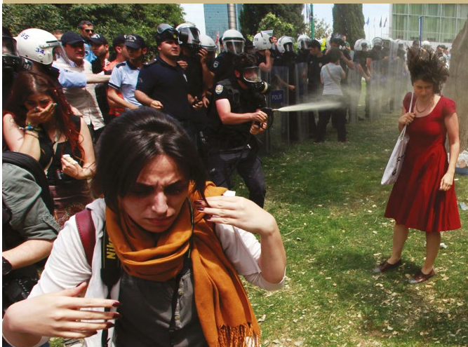
Manifestation sur la place Taksim (Turquie, juin 2013)