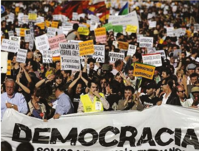
Manifestation étudiante pour l'accès à l'enseignement au Chili.